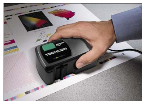
Schnell und einfach zu bedienen!